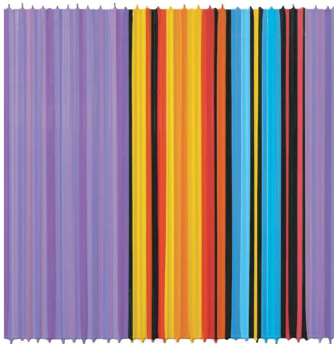
"Snail Where Are You" (Tomi Ungerer)