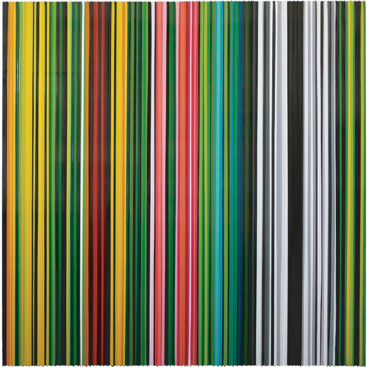
"Moon Man Visits Earth" (Tomi Ungerer)

Ouvert du mercredi au samedi de 14h à 19h et sur rendez-vous