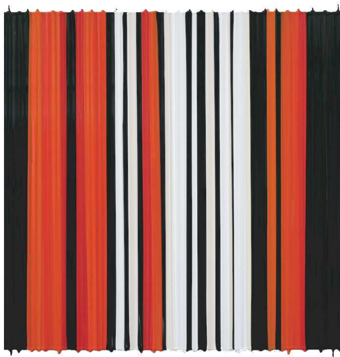
"Montreaux 1993" (Tomi Ungerer)

C'est comme une façon différente de regarder le travail d'un peintre.