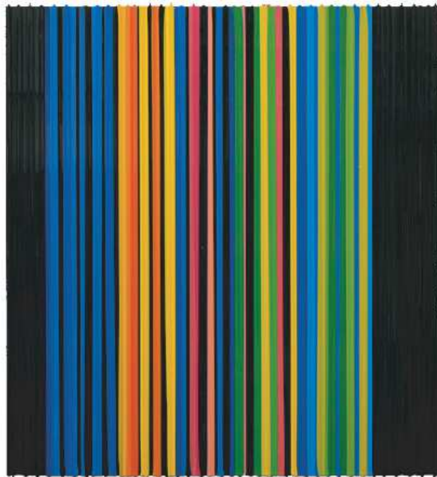
"The Three Robbers, The Next Morning She Awoke to Find Herself Surrounded by Trunks of Glittering Riches (Tomi Ungerer)

Ces choix furent le point de départ d'un long travail de recherche et de documentation qui l'a fait voyager à travers l'oeuvre foisonnante de Tomi Ungerer.