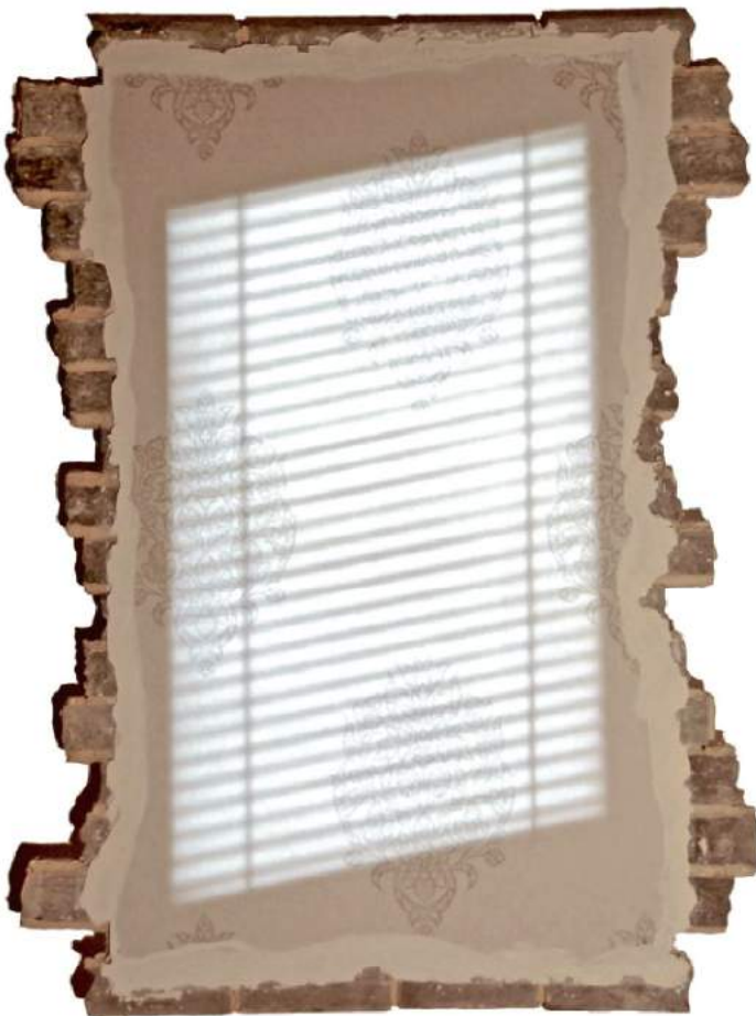
"Residue" (Mixed Media, LEDs, Papier peint)

Le lieu et le temps exacts où se produisent ces passages sont flous, mystérieux et ouverts à l'interprétation.