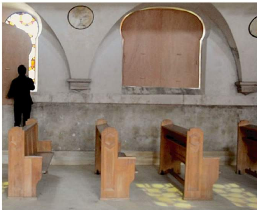
"Les Résidus du Vide" - Ancienne synagogue de Reischoffen (F)

Des bourses lui ont été attribuées pour des installations commandées par le district de Londres/Kensington et Chelsea, le Conseil de l'Europe pour son siège à Strasbourg et les éditeurs Routledge.