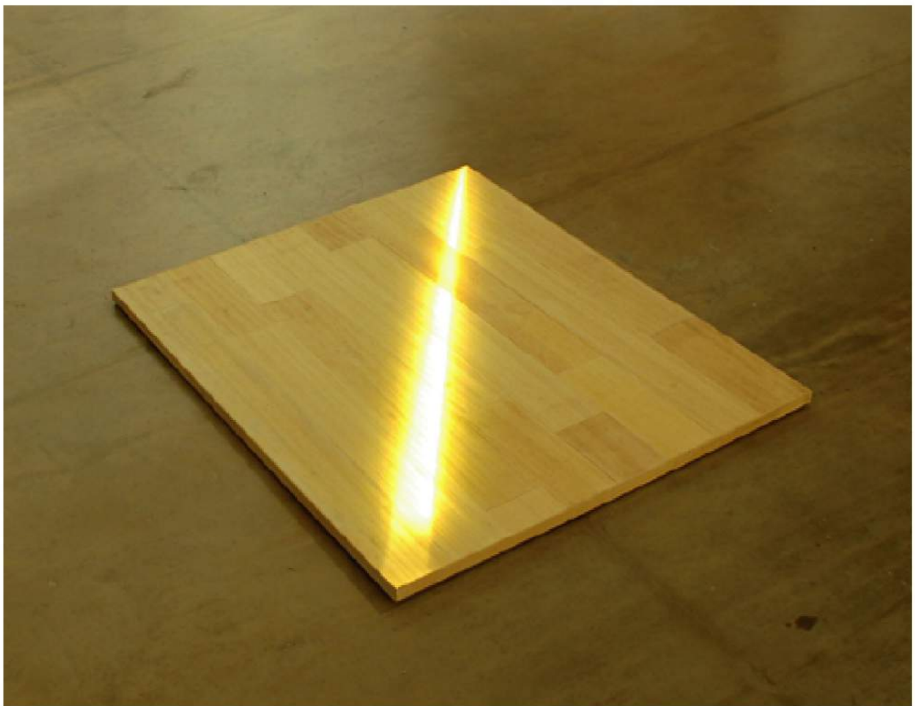
"You haven't eaten all your leftovers III" (bois, verre et Led )

Ouvert du mercredi au samedi de 14h à 19h et sur rendez-vous