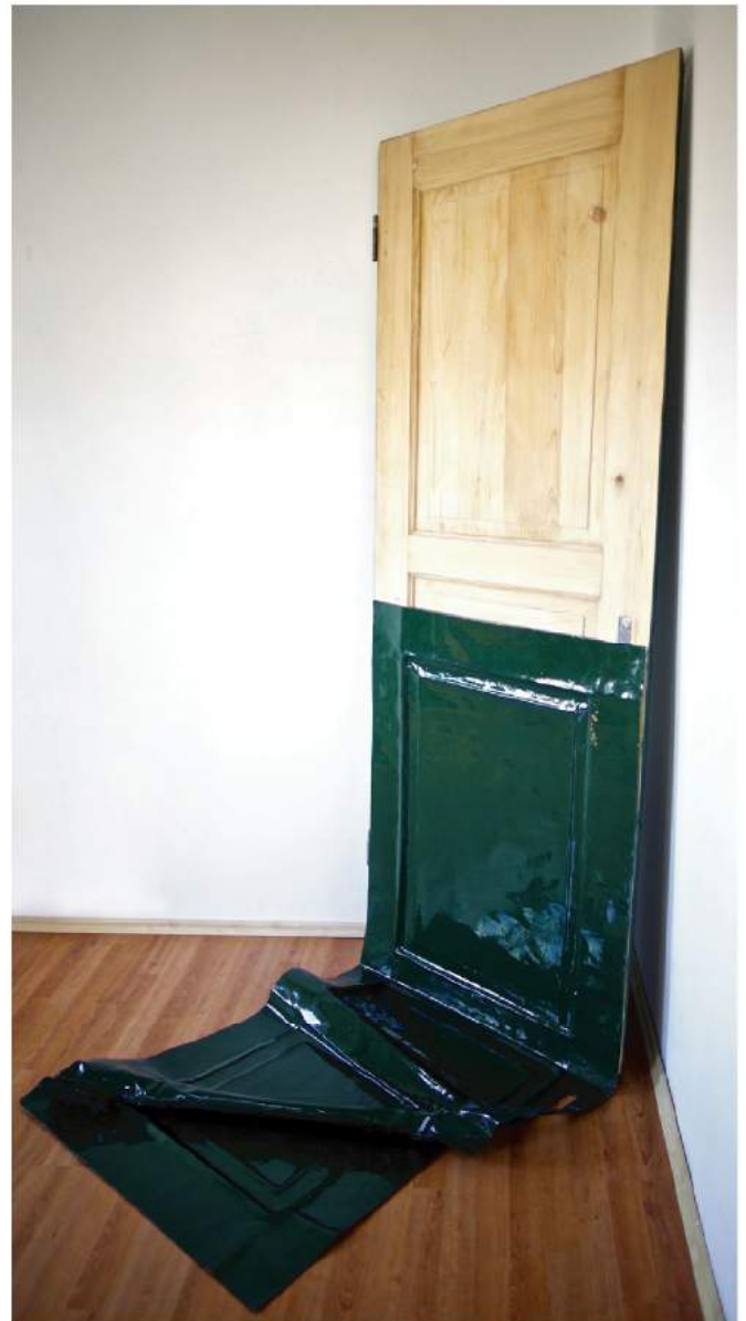
"Transgression" (Porte en bois et fibre de verre)