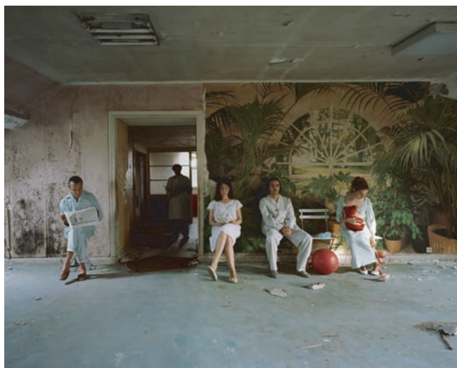
"La salle d'attente"

Avec la série Hôpital , elle plante ses modèles dans un décor d'hospice décati et franchement inquiétant. Entre asile de fous façon Shining et ambiance de fin du monde, ces clichés troublent.