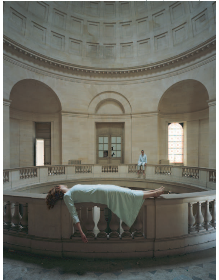
"La Chapelle", série "Hôpital"

du jeudi au dimanche de 14h à 19h et sur rendez-vous