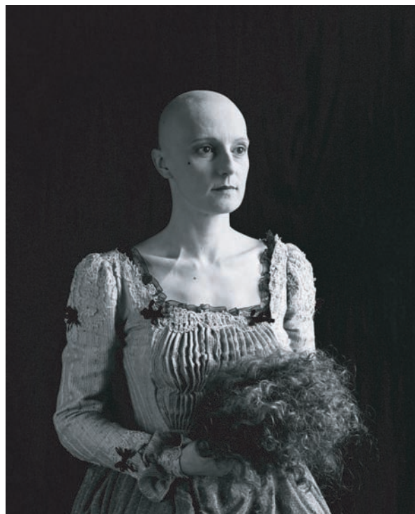
"29 juillet "