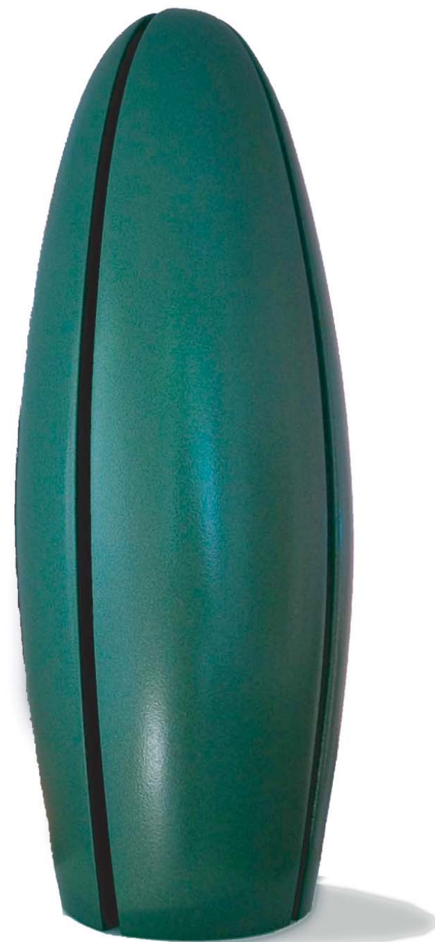
Sound Capsule 2006