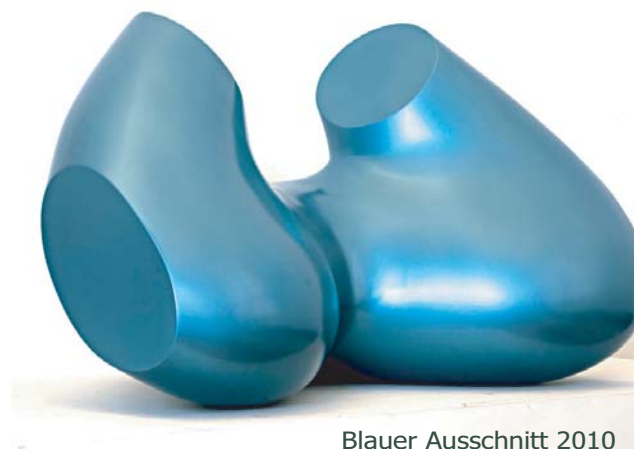
Blauer Ausschnitt 2010