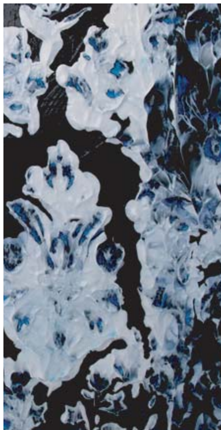
Thème : Wall paper